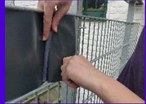
... dann wieder in die Ausgangsrichtung gehalten – wird der KREATIVO mittels Klemmschiene, an den Mattenstab befestigt.