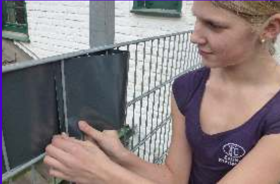
Am Ende der Matte wird das Stück Sichtschutz zurückgeführt und einmal wieder in die entgegengesetzte Richtung eingeflochten....