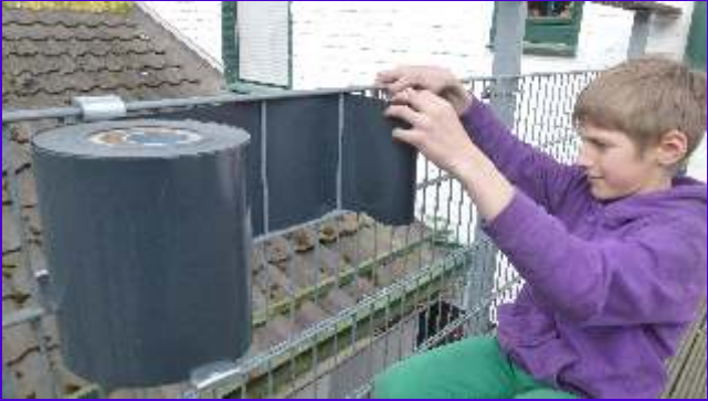
Der KREATIVO wird durch Einflechten zwischen den Stäben angebracht. Der hier gezeigte Abroller ist auch bei uns erhältlich.