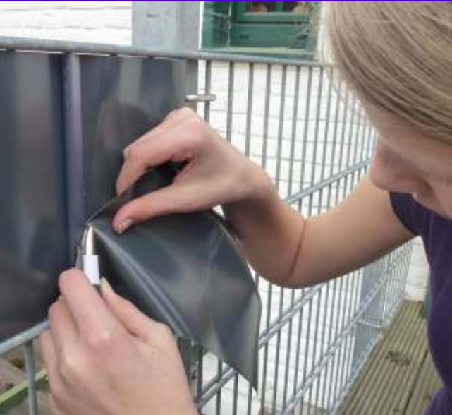
Man schneidet das Ende mit einem scharfen Messer (Teppichmesser o.ä.) ab....