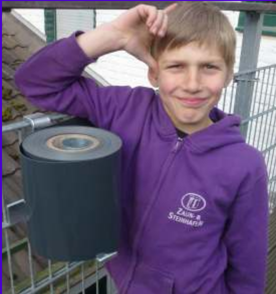
... und schon ist man fertig! Kinderleicht ...